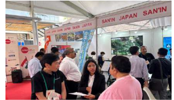
R7.10 JAPAN MERA