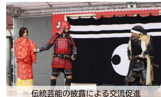
伝統芸能の披露による交流促進

過年度／やすぎ刃物まつり、よどえ夢まつり、みなと祭り、出雲神話まつり、松江水燈路等