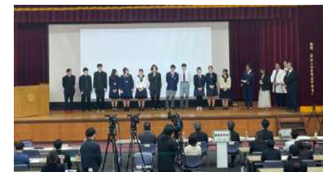
発明額コンテスト