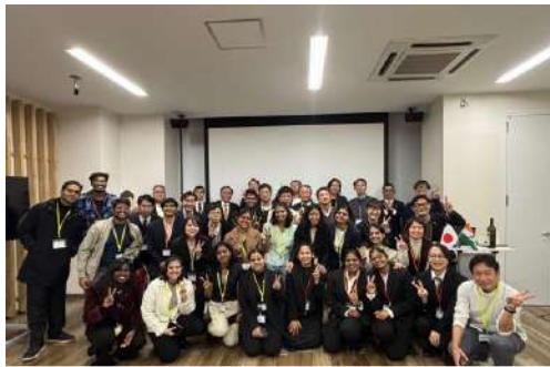
産官学交流会（ナマステ交流ナイト）