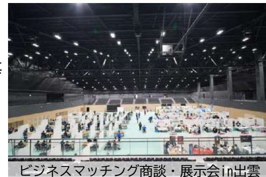
ビジネスマッチング商談・展示会in出雲