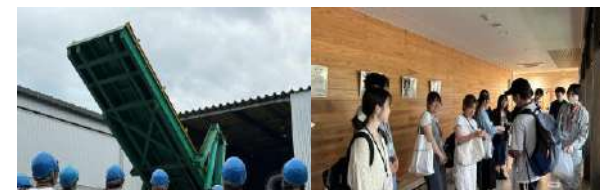
島根大学 若者を共に育てるプロジェクト