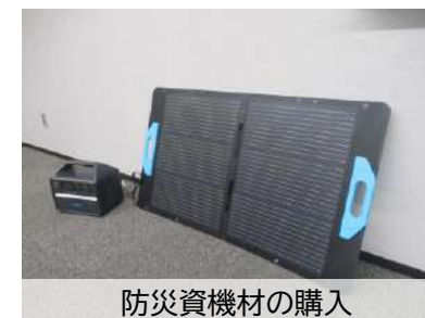
防災資機材の購入