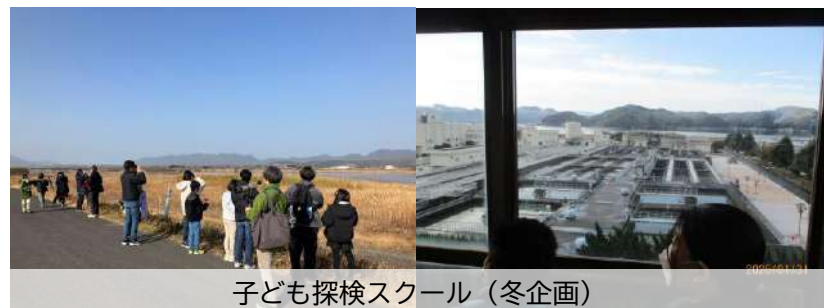
子ども探検スクール（冬企画）