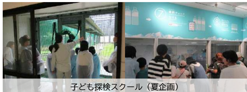
子ども探検スクール（夏企画）