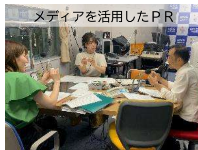
メディアを活用したPR