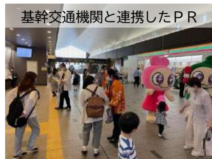
基幹交通機関と連携したPR