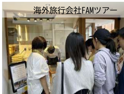
海外旅行会社FAMツアー