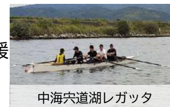
中海宍道湖レガッタ