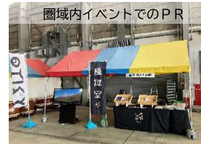
圏域内イベントでのPR