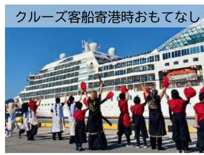
クルーズ客船寄港時おもてなし