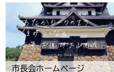
市長会ホームページ