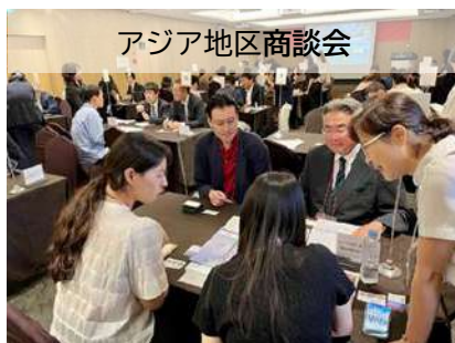
アジア地区商談会