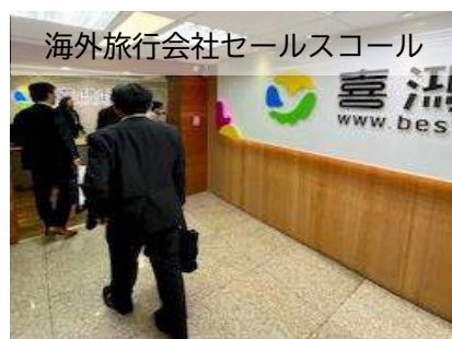
海外旅行会社セールススクール